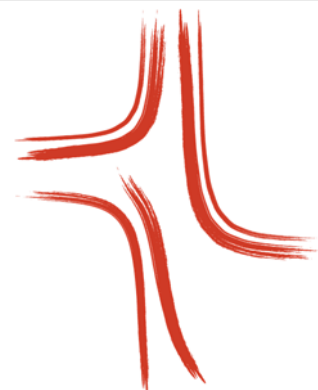
Figura 1 – Descrição Figure 1 - Description