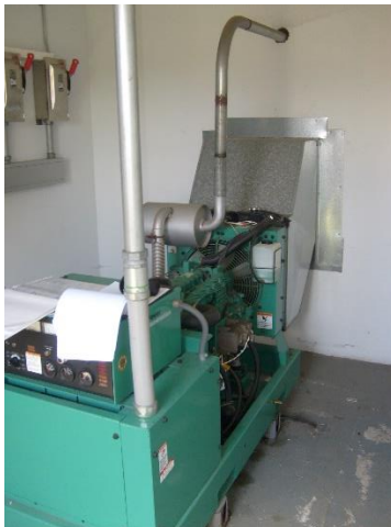
Figura 1 – Gerador instalado no edifício T-924. Figure 1– Generator installed in the building T-924.

Due to life cycle Real Property equipment target, several Generators base wide were identified for replacement. Other Works included installation of new louvers and installation of new Fuel tanks.