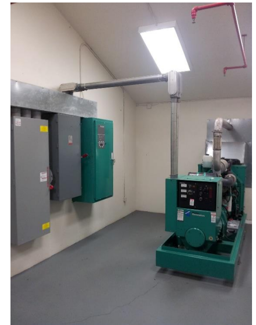
Figura 3 – Gerador instalado no edifício T-1012. Figure 3 – Generator installed in the building T-1012.

Período de Construção / Construction Period: Junho 2012 / June 2012